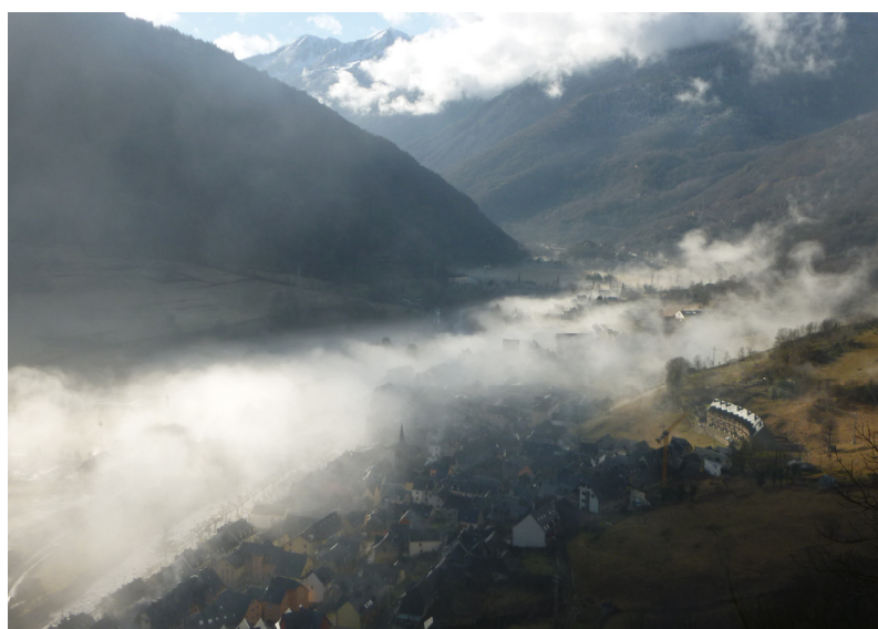
Bossòst desde el Castèth d'Azemarius

En la parte baja de la Plaça dera Glèisa giramos a la izquierda por la c/Major que más adelante se transforma en la c/de Sant Ròc y nos lleva a la ermita del mismo nombre. Desde Sant Ròc (9) seguimos por la misma calle que se convierte en el Camin des Paliàs . Llegamos de nuevo al cruce del Camin dera Còva y continuamos hasta el camping por el mismo camino del inicio de la excursión.